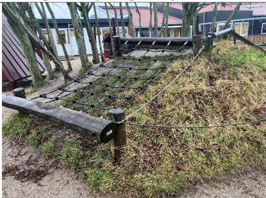
Redskab: Klatretræ Årgang: Producent: Nikostine Er redskabet mærket: Ja men, år er ulæselig Er der registreret fejl/mangler: Ja