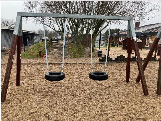
Redskab: Gyngestativ Årgang: 2011 Producent: Rudeco Er redskabet mærket: Ja Er der registreret fejl/mangler: Nej