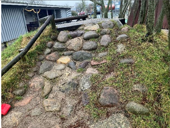
Redskab: Stendige Ikke omfattet af DE/EN 1176