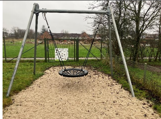
Redskab: Gyngestativ Årgang: 2021 Producent: Kompan Er redskabet mærket: Ja Er der registreret fejl/mangler: Nej