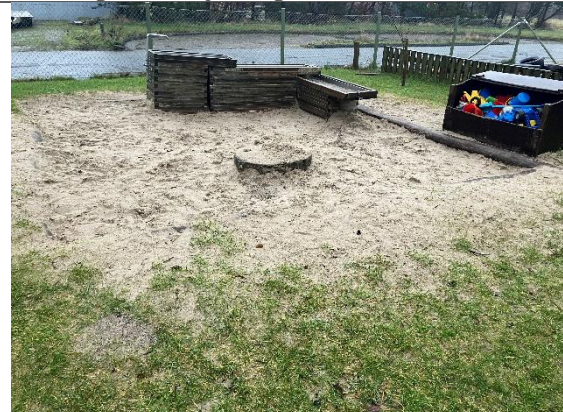
Redskab: Sandkasse Årgang: Producent: Er redskabet mærket: Nej Er der registreret fejl/mangler: Ja