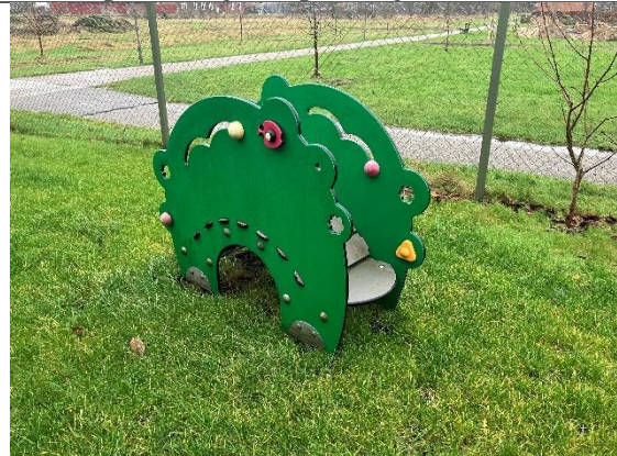
Redskab: Balance redskab Årgang: 2014 Producent: Kompan Er redskabet mærket: Ja Er der registreret fejl/mangler: Nej