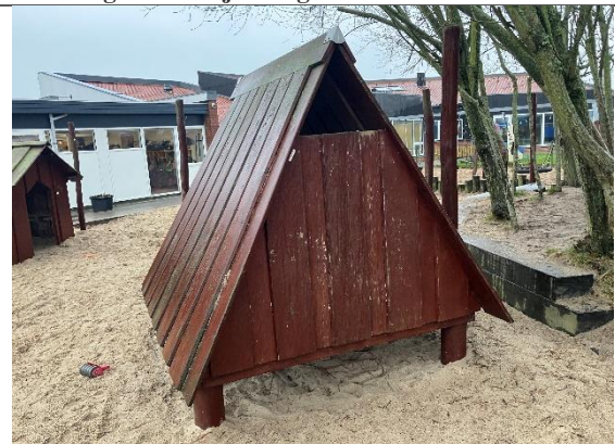
Redskab: Legehus Årgang: 2018 Producent: Nikostine Er redskabet mærket: Ja Er der registreret fejl/mangler: Ja