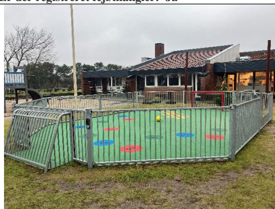
Redskab: Pannabane Ikke omfattet af DE/EN 1176