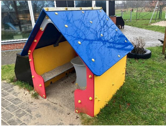
Redskab: Legehus Årgang: 2018 Producent: Ledon Er redskabet mærket: Ja Er der registreret fejl/mangler: Nej