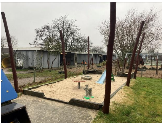
Redskab: Sandkasse med solsejlsstolper Årgang: 2016 Producent: JRJ Ribe Er redskabet mærket: Ja Er der registreret fejl/mangler: Nej