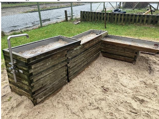
Redskab: Lege køkken Årgang: Producent: Er redskabet mærket: Ja men ulæselig Er der registreret fejl/mangler: Ja