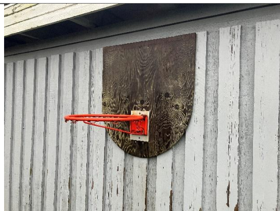
Redskab: Barsketballnet Ikke omfattet af DE/EN 1176