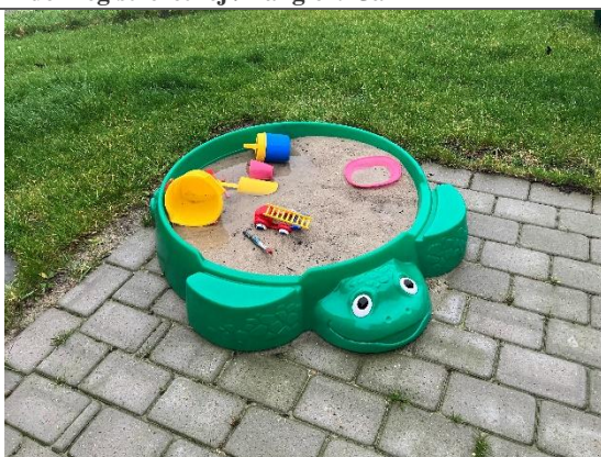
Redskab: Flytbar sandkasse Ikke omfattet af DE/EN 1176

Beskrivelse af de redskaber som er inspiceret på legepladsen: