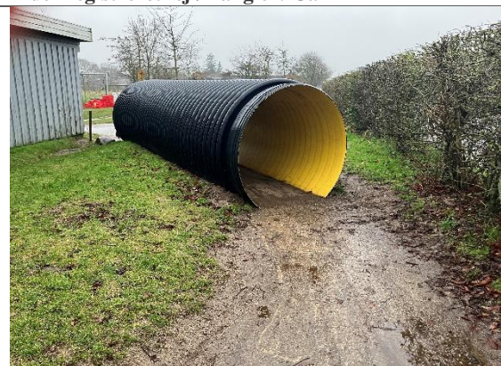
Redskab: Tunnel Årgang: Producent: Er redskabet mærket: Nej Er der registreret fejl/mangler: Nej