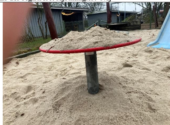
Redskab: Sandbord Årgang: Producent: Er redskabet mærket: Ja/ ikke læselig Er der registreret fejl/mangler: Nej