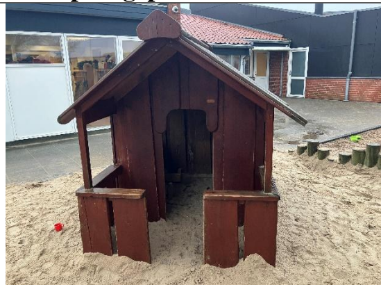
Redskab: Legehus Årgang: 2018 Producent: Nikostine Er redskabet mærket: Ja Er der registreret fejl/mangler: Ja