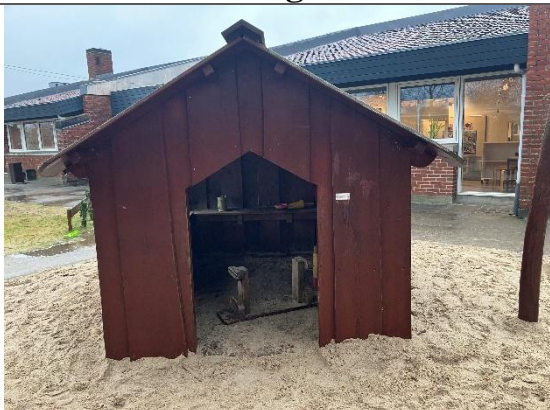
Redskab: Legehus Årgang: 2018 Producent: Nikostine Er redskabet mærket: Ja Er der registreret fejl/mangler: Ja