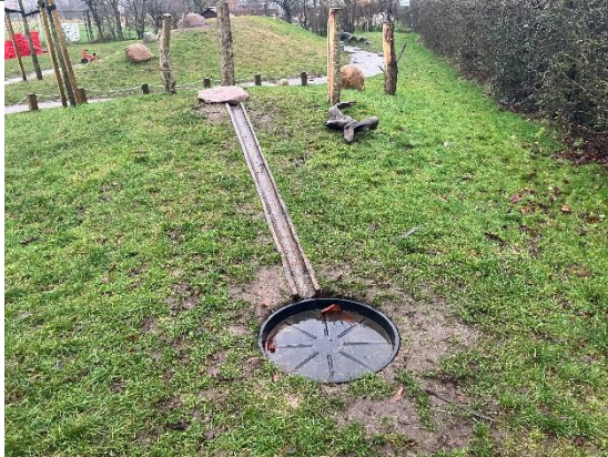
Redskab: Vand leg Årgang: Producent: Er redskabet mærket: Nej Er der registreret fejl/mangler: Nej