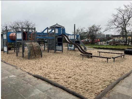
Redskab: Klatretårn med rutsjebane Årgang: 2005 Producent: Lappset Er redskabet mærket: Ja Er der registreret fejl/mangler: Ja