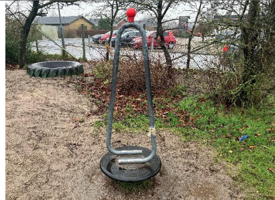
Redskab: Karrusel Årgang: 2018 Producent: Nikostine Er redskabet mærket: Ja Er der registreret fejl/mangler: Ja