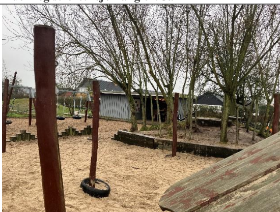
Redskab: Solsejlsstolper Ikke omfattet af DE/EN 1176