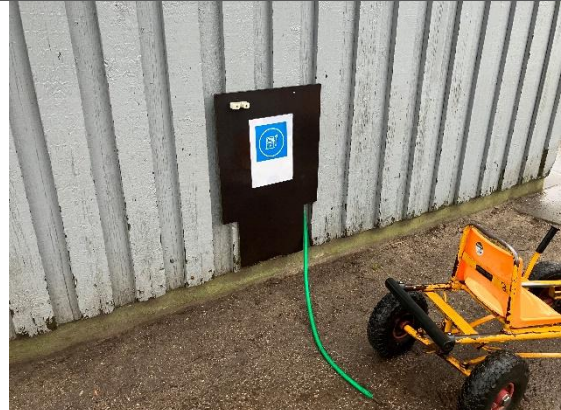
Redskab: Tankstønder Ikke omfattet af DE/EN 1176