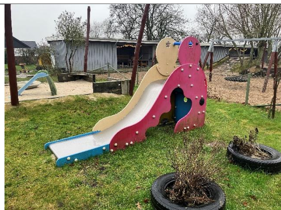
Redskab: Rutsjebane Årgang: 2011 Producent: Kompan Er redskabet mærket: Ja Er der registreret fejl/mangler: Nej