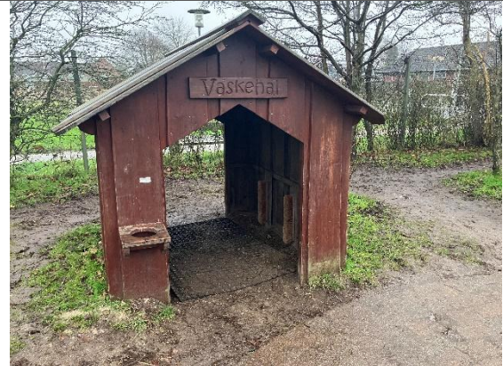
Redskab: Vaskehal Årgang: Producent: Nikostine Er redskabet mærket: Ja men, år er ulæselig Er der registreret fejl/mangler: Nej