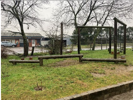
Redskab: Balance redskab Årgang: 2008 Producent: Rejstrup Savværk Er redskabet mærket: Ja Er der registreret fejl/mangler: Ja