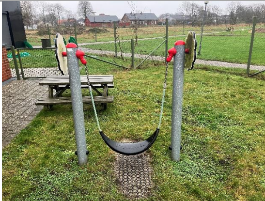
Redskab: Mavegynge Årgang: 2018 Producent: Kompan Er redskabet mærket: Ja Er der registreret fejl/mangler: Ja