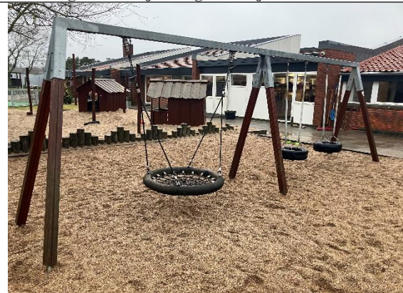
Redskab: Gyngestativ Årgang: 2011 Producent: Rudeco Er redskabet mærket: Ja Er der registreret fejl/mangler: Ja