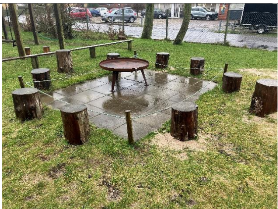
Redskab: Bål plads Ikke omfattet af DE/EN 1176